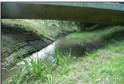
Abb. 1: zerstörte Ufer- und Sohlbefestigung nach HW-Ereignis Juni 2012, 09.10.2018