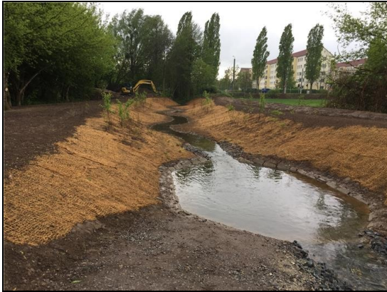
Abb. 9: Sedimentfang unterstrom Pirnaer Landstr. kurz vor Fertigstellung, 02.05.2017