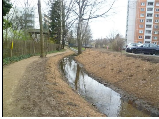
Abb. 8: Fußweg am neugestalteten und ingenieurbologisch gesicherten Gewässer, 23.03.2017