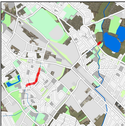
Lageplan Maßnahme, Maßstab 1:50000