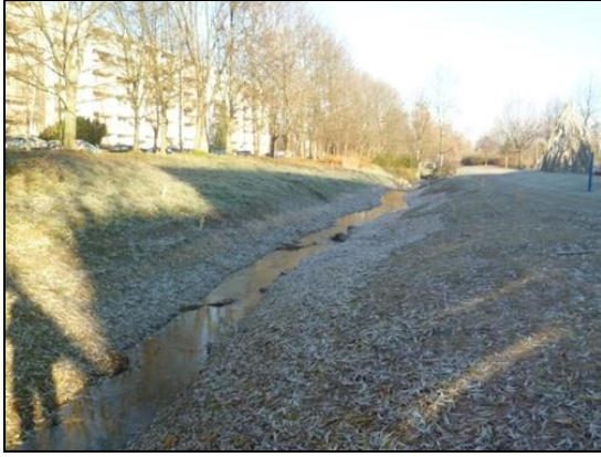
Abb. 7: Gewässerstrecke mit flachen Bermen, 29.11.2016