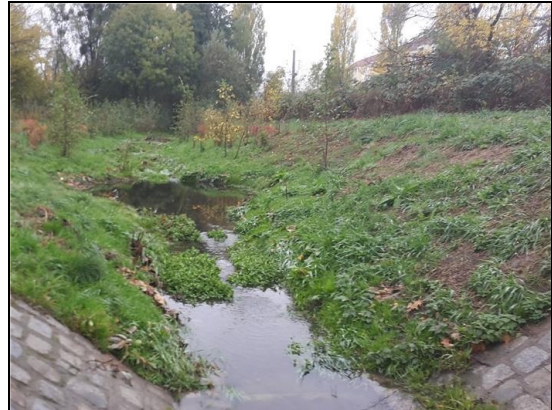
Abb. 10: Sedimentfang unterstrom Pirnaer Landstr., 29.10.2018